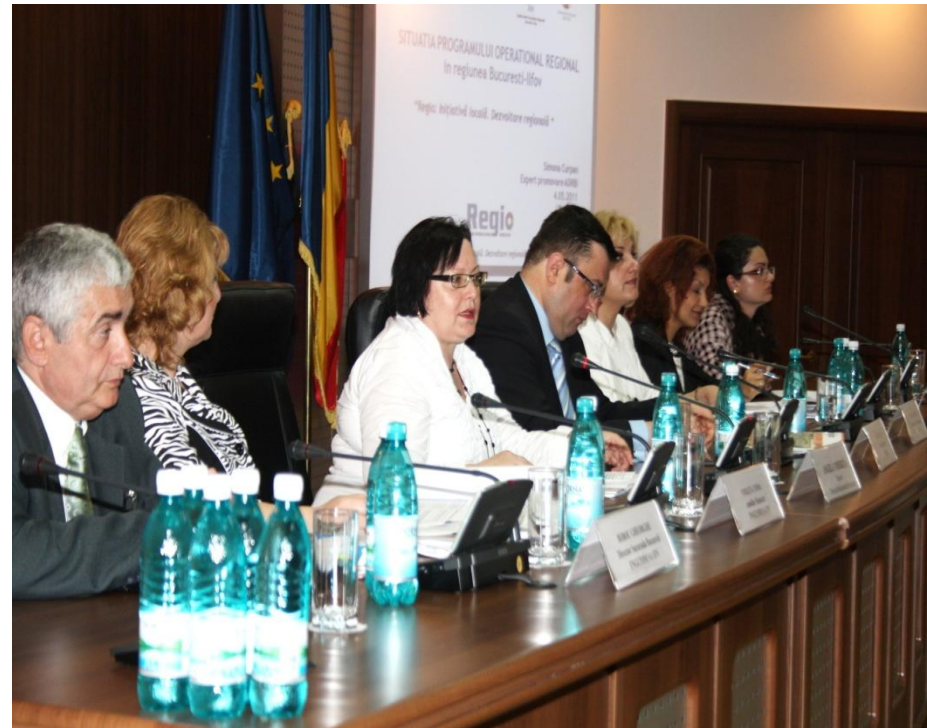
Primaria sector 2